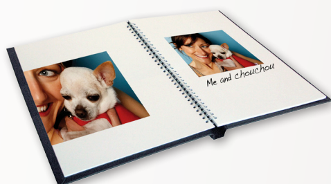
SteelBook pro Punch SteelBinding